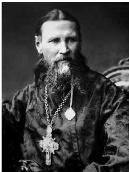
Св. Иоанн Кронштадтский

ная Церковь учит нас, грешных, что земная жизнь дана нам исключительно для покаяния. Искреннее покаяние, рождая в сердце неприязнь к грехам, требует от нас не только их исповедания, но и последующего их исправления в жизни, становления души, но путь добрых помыслов и дел. К сожалению, русский народ, в том числе и казаки, заняты всем чем угодно, только не покаянием. Это тем более горько, что русский народ, некогда народ-богоносец, мог бы воспринять на себя